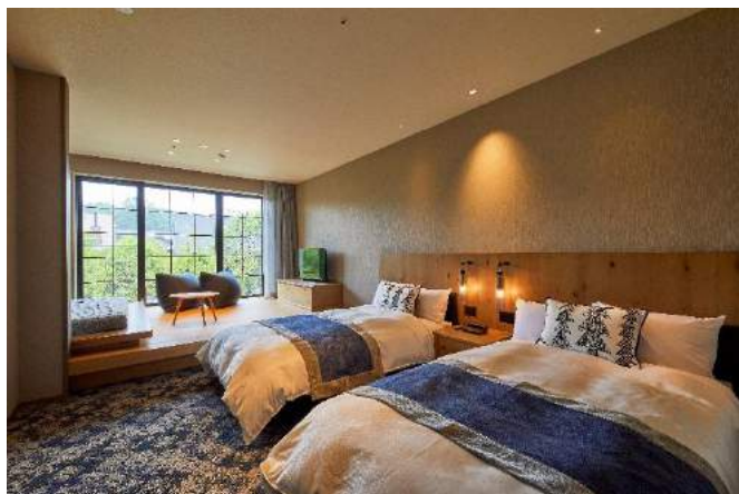
ハーヴェストクラブ客室

会員権募集においても総募集口数の8割以上の販売が終了し、当初の予想を大きく上回るペースで販売が進んでおります。