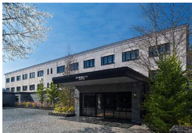
KYUKARUIZAWA KIKYO, Curio Collection by Hilton