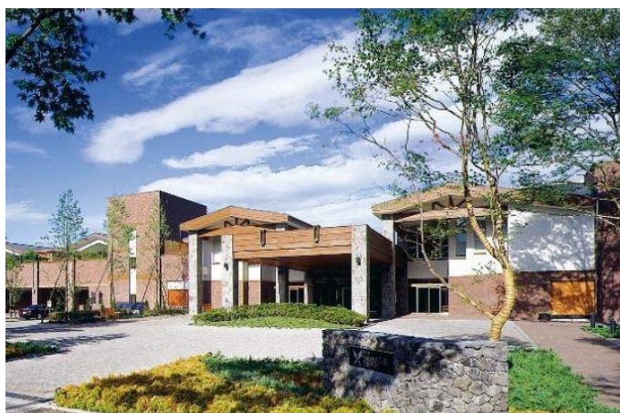
東急ハーヴェストクラブ旧軽井沢

2001年7月、伝統ある旧軽井沢の地に「東急ハーヴェストクラブ旧軽井沢」が誕生して以来、2007年には「東急ハーヴェストクラブ旧軽井沢アネックス」、2018年4月にはヒルトン日本初進出のブランドホテルである「KYUKARUIZAWA KIKYO, Curio Collection by Hilton」など、東急不動産のホテル事業は軽井沢の地で展開が進んでおります。今回誕生する「東急ハーヴェストクラブ軽井沢&VIALA」もそのひとつ。国内外にある有数のリゾート地で多様な施設を展開してきたノウハウを生かし、軽井沢の地域特性を踏まえた更なる魅力付けに取り組んでおります。