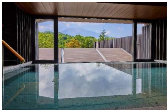
露天風呂付温泉大浴場