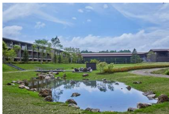
パブリック棟外観とグリーンフィールド