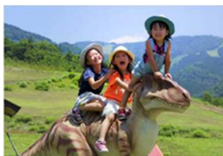
わんぱく恐竜ランド