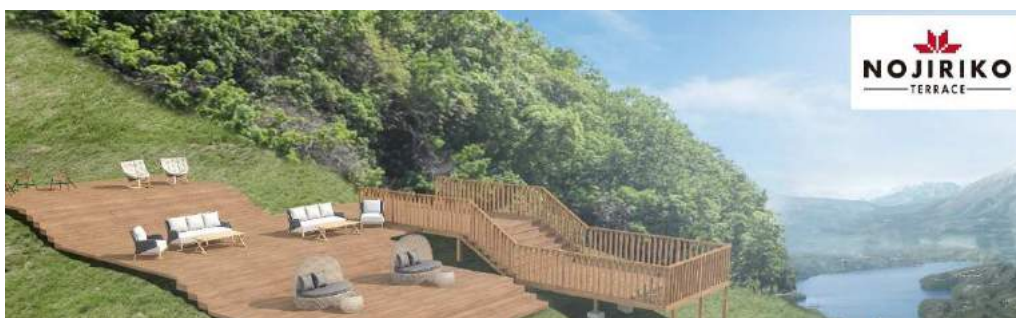
野尻湖テラス 完成イメージ

その他、夏季限定のイベントとして「ゆり&ラベンダーパーク」も同時開催をしており、タングラムスキーサーカス内では、スーパーボブスレーやボルダリング施設、パターゴルフ場、温泉大浴場等、様々なアクティビティを有した施設で大人から子どもまで楽しい時間をお過ごし頂けます。