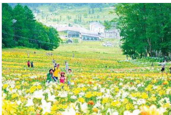
ゆり&ラベンダーパーク