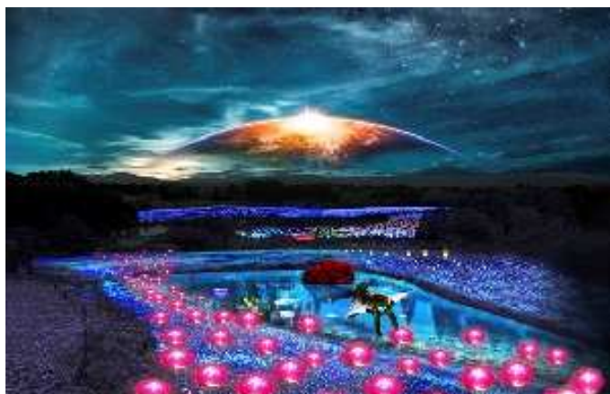
ジオ・イルミネーション イメージ

その他にもセグウェイ体験や標高1,000mの高原ならではのパラグライダー、ゲレンデを利用した芝そり、恐竜をテーマにした子ども向けのパーク「わんぱく恐竜ランド」など、家族連れでもお楽しみいただけます。