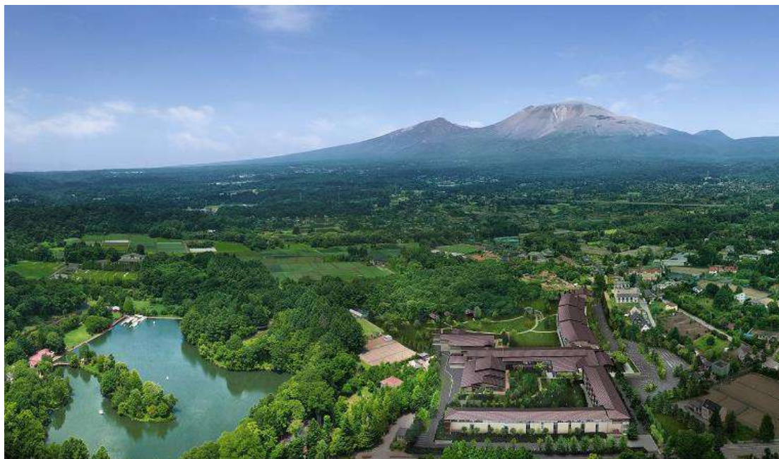
東急ハーヴェストクラブ軽井沢&VIALA 外観イメージ

東急ハーヴェストクラブでは、昨年10月、新たな戸建タイプのホテルとして「那須 Retreat」を新規開業しており、現在も「軽井沢」において建設中の「東急ハーヴェストクラブ軽井沢&VIALA」がいよいよ本年7月20日に新規開業いたします。今後も東急ハーヴェストクラブでは、お客さまのニーズにお応えする上質な会員制ホテルを展開してまいります。