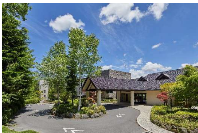
開業30周年を迎えた、東急ハーヴェストクラブ蓼科